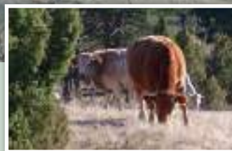
7. Paisaje ganadero.