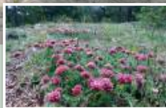
6. Prados de montaña.