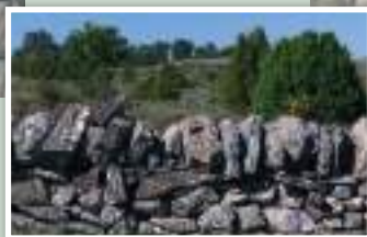
5. Cerrada de piedra seca.