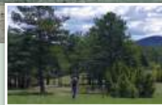
8. Entre prados y bosques.