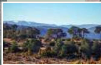
4. Pinar adeshado.