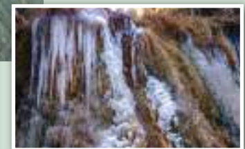
10. Paisaje invernal del río Mijares.