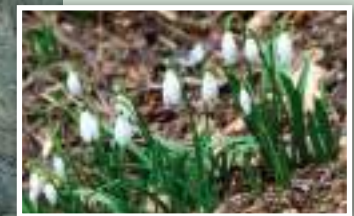
11. Campanilla de invierno.