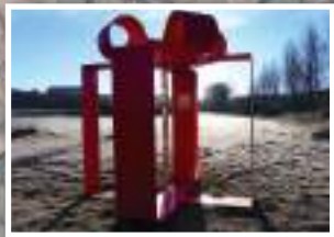
1. Parque escultórico.