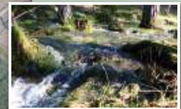
12. Río de montaña mediterránea.