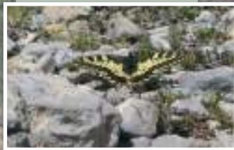
3. Un paraje rico en mariposas.