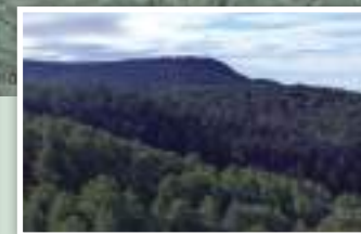
9. Los extensos pinares de Cedrillas.